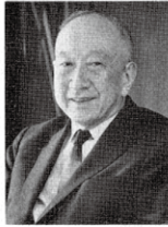
経済団体連合会会長