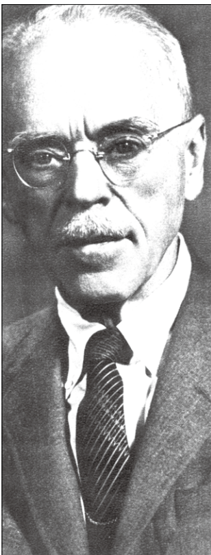
国際心臓財団 創立者・会長 ポール・D・ホワイト博士