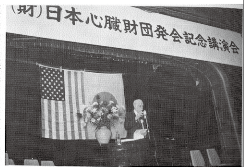
5月6日、日本工業倶楽部講堂で開かれた「日本心臓財団発会記念講演会」で講演するP・ホワイト博士。各界から集った多数の聴衆を前にホワイト博士は心臓病を予防するには何よりも“not to grow fat or to smoke, walk, walk and walk”であると力説された。